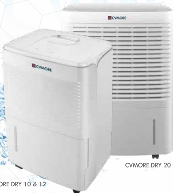
CVMORE DRY 10 & 12